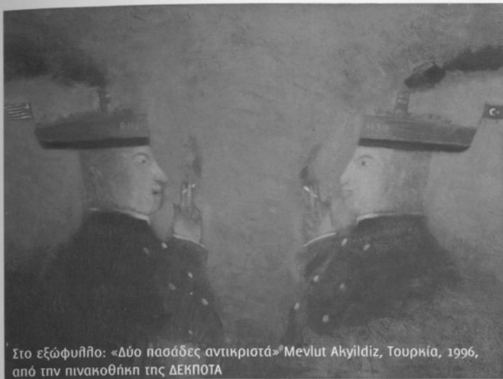
Στο εξώφυλλο: «Δύο πασάδες αντικριστά» Mervut Akyildiz, Τουρκία, 1996, από την πινακοθήκη της ΔΕΚΠΟΤΑ