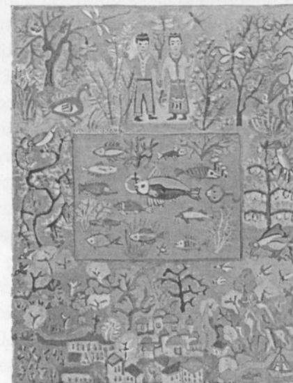
«Γαμήλιος κήπος» (τέμπερα).

(Γεν. 1962, Ρόδος). Φιλόλογος, ιστορικός.