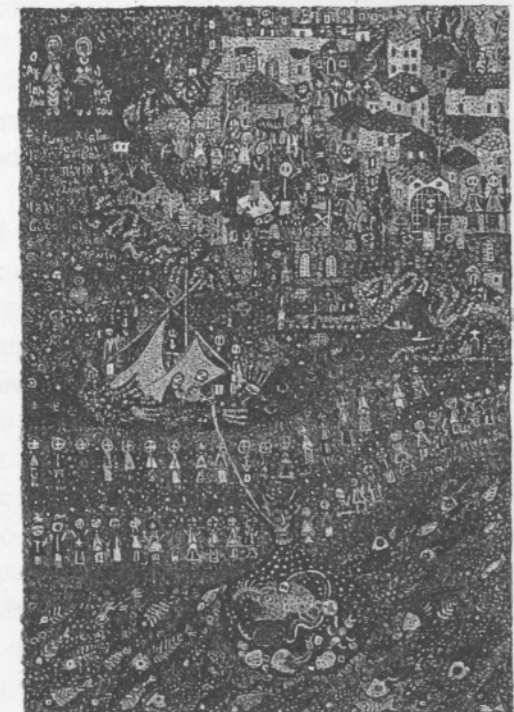
«Μνήμη Αγίου Ιουλιανού» (τέμπερα).