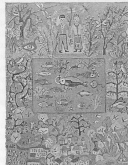
«Γαμήλιος κήπος» (τέμπερα).