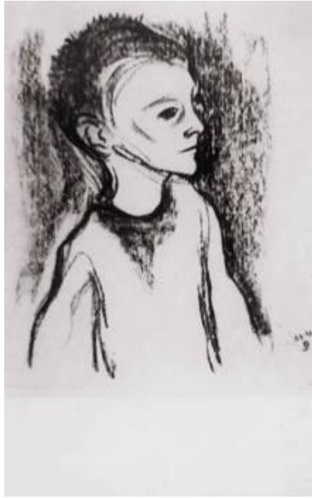
«Παιδιά της πείνας», Βάλιας Σεμερτζίδης, 1942

[Βαλεντίνος Σεμερτζίδης, Από την πρώτη μέρα της Εθνικής Αντίστασης ο Σεμερτζίδης βρίσκεται στις γραμμές της. Ζωγραφίζει μια σειρά συνθέσεων με θέματα τη πείνα και τον αγώνα του Λαού της Αθήνας].